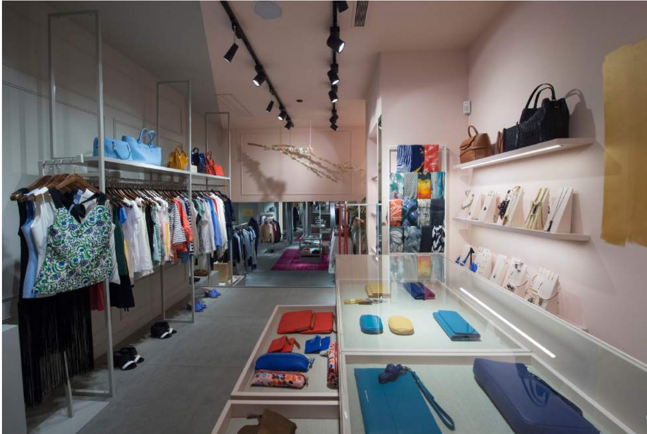
Un nuevo concepto de tienda más luminoso y creativo