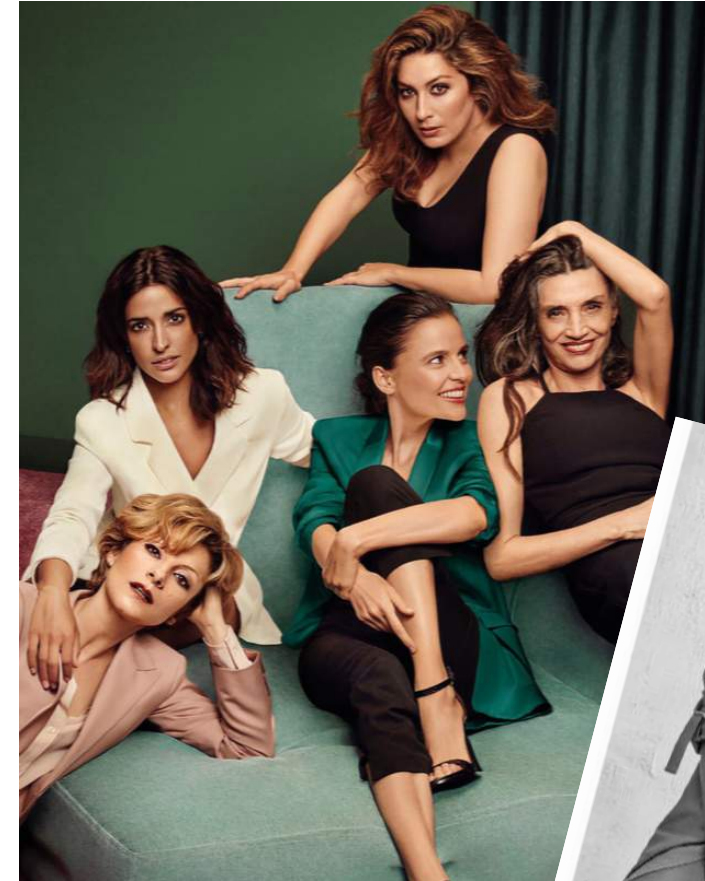
Imagen de la 1º campaña de marca en 10 años #estonoesunselfie